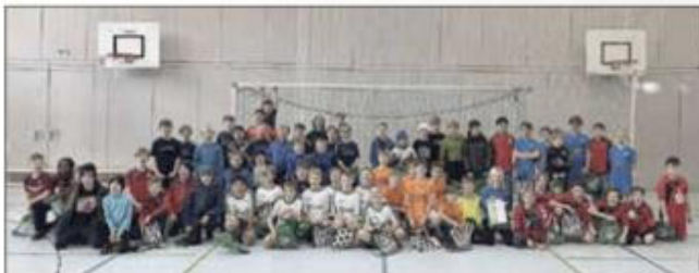
Beispielhaft das Gruppenfoto der Teilnehmer am U11 Turnier

Und was soll man sagen: Trotz der über 5-jährigen Abstinenz der Hallenturnierserie war sie gleich auf Anhieb wieder ein grandioser Erfolg. Sehr gut gefüllte Zuschauerränge, ein absolut reibungsloser Ablauf vom Anfang bis zum Ende und vor allem stolze Eltern und glückliche Kindergesichter bei den Siegerehrungen haben wieder einmal eindrucksvoll gezeigt, welche Power ein Verein entwickeln kann, wenn alle an einem Strang ziehen. Natürlich spielte auch der sportliche Wettkampf bei den Turnieren eine große Rolle und fast alle Partien waren bis zum Ende heiß umkämpft. Fast noch wichtiger war aber wieder mal die Erkenntnis, wie wichtig solch gesellschaftliche Großereignisse für die Vereins- aber auch die Dorfgemeinschaft unseres Ortes sein können. Der meistgehörte Satz an diesem Wochenende war mit Sicherheit: „So ein eigenes Turnier möchte ich jetzt jedes Jahr spielen“. Dieser Aussage der Kids ist, denke ich, nichts hinzuzufügen.