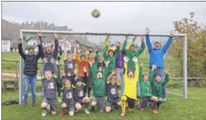
So sehen Sieger aus - die zweifachen Meister der Marquartsteiner E-Jugend in Feierlaune

Herzlichen Glückwunsch Jungs! Weiter so!