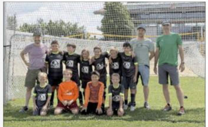
Das Foto zeigt die Mannschaft nach dem letzten Spiel in Chieming und dem Erreichen des Meistertitels ohne Punktverlust

Jetzt geht es aber erst einmal in die verdiente Sommerpause, bevor die Kinder ab September wieder in die neue Spielrunde einsteigen.