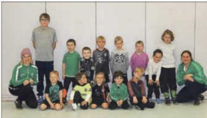
Die kleinsten Nachwuchskicker des TSV Marquartstein mit dem Trainerteam der Bambinis

Wenn auch Ihr Kind Interesse an Spiel und Spaß mit dem Ball hat, mindestens fünf Jahre alt ist und gemeinsam in der Gruppe erste Erfahrung im Fußball sammeln möchte, nehmen Sie gerne Kontakt zu uns auf. Auf der Internetseite des TSV Marquartstein finden Sie die Kontaktdaten der Trainer, die Ihnen gerne bei der Wahl der richtigen Mannschaft behilflich sind. Vielleicht möchten Sie auch selber als Trainerperson aktiv werden? Wir freuen uns stets über engagierte Leute, die den Fußball als Breitensport gerade im Kinder- und Jugendbereich beim TSV Marquartstein unterstützen und begleiten.