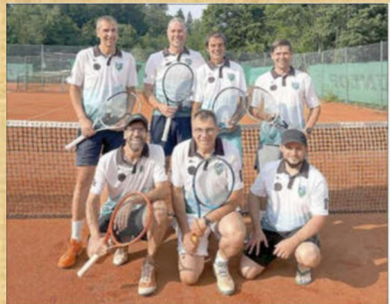
Die Herren 40 schafften in der Landesliga den vorzeitigen Klassenerhalt.

Die Damen um Eva Wagner verloren das Lokalderby gegen den TC Übersee II unglücklich mit 2:4. Hier wurde gleich drei Punkte im Champions-Tiebreak knapp verloren. Die Damen 30 verloren ihr letztes Saisonspiel beim TV Obing mit 0:6. Damit landeten die Damen 30 um Birgit Bayersdorfer auf dem 5. Tabellenplatz.