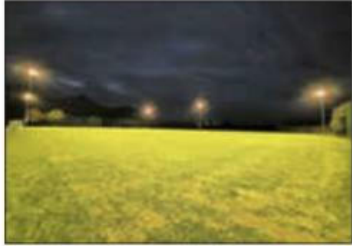
Der Trainingsplatz in Freiweidach erstrahlt endlich wieder im neuen Glanz