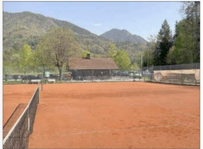
Die Tennisplätze sind seit dem 8. April bespielbar.