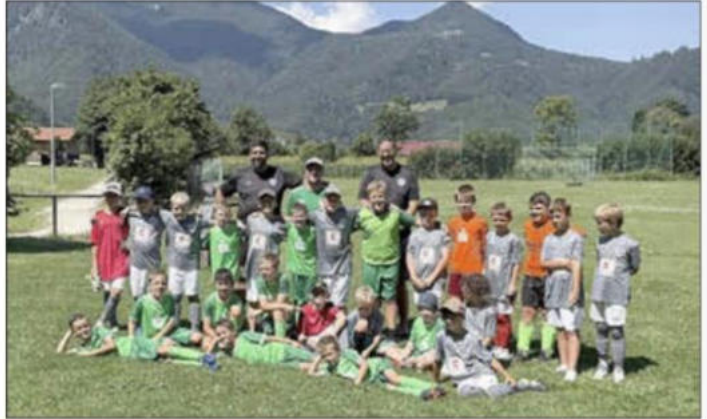
Gruppenfoto der Wünsdorfer und Marquartsteiner Nachwuchskicker

Begegnung im nächsten Jahr erneut stattfinden zu lassen. Und wer weiß – vielleicht ergibt sich auch einmal für unsere Jugendmannschaften die Gelegenheit für einen Besuch in Nähe der Bundeshauptstadt.