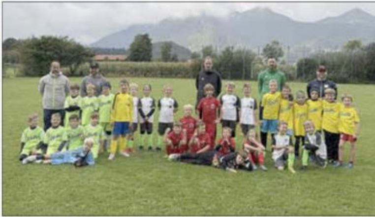
Gruppenfoto der teilnehmenden Teams beim Marquartsteiner Heimfestival

Nach einer erholsamen Sommerpause ist unsere F-Jugend mit voller Energie und großem Teamgeist in die neue Saison gestartet. In diesem Jahr wurde der Nachwuchs erstmals in zwei Mannschaften unterteilt – die F1 und die F2 – um allen Kindern noch mehr Spielzeit, Förderung und individuelle Entwicklung zu ermöglichen.